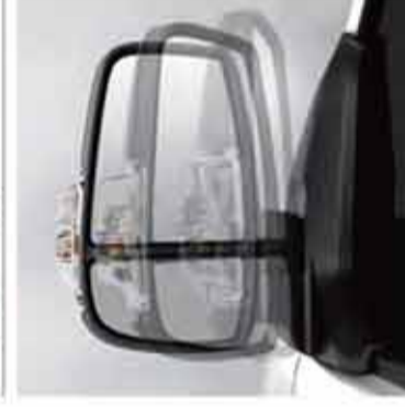
Elektrikli Katlanabilir Aynalar