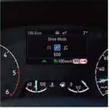
Seçilebilir Sürüş Modları