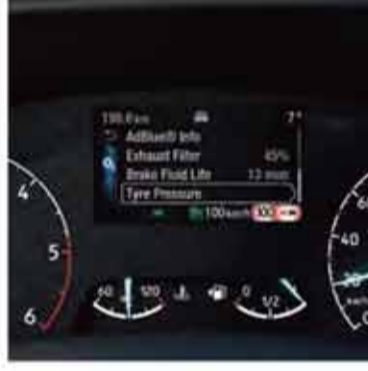
Araç Bakım Monitörü