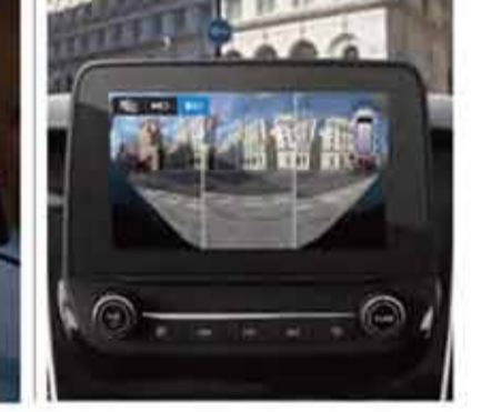
180° Görüş Sağlayan, Geniş Açılı Ön Kamera