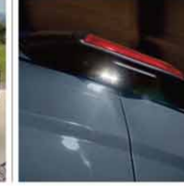
Geri Görüş Kamerası