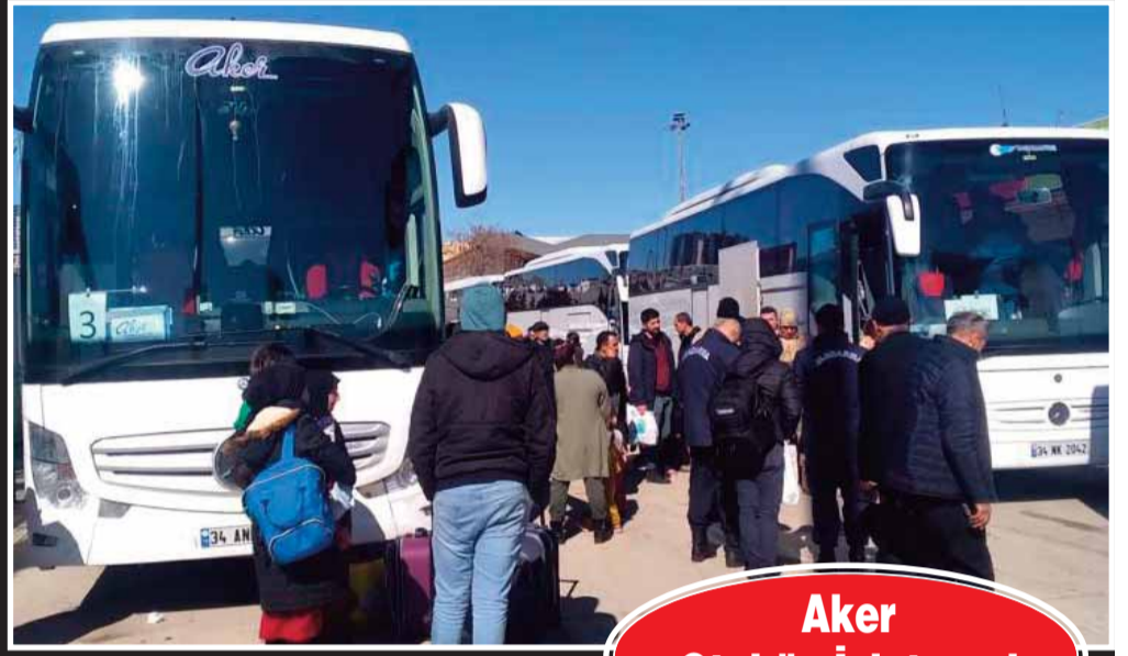
Aker Otobüs İşletmesi