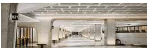
Galataport'ta turizm otobüslerine tahsis edilen park alanı

bu durum ister istemez sıkıntılara yol açacak. Bu nedenle otopark konusuna bir çözüm bulunması gerektiğini Vali beye ilettik' dedi.