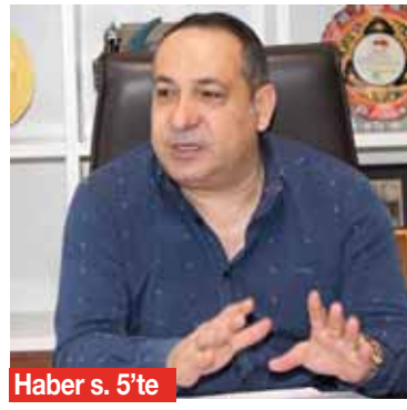
Haber s. 5'te